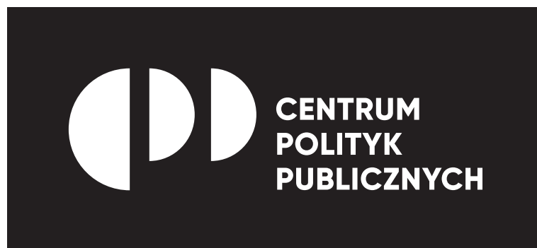
Główny logotyp w bieli i czerni