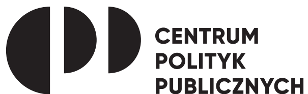
Główny logotyp w czerni