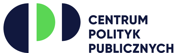
Główny logotyp w podstawowych kolorach